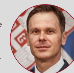
Siniša Mali Finanzminister und Vizepremier von Serbien

Siniša Mali erläutert in seinem Beitrag für die Handelszeitung die Bedeutung der Expo 2027 für Serbien und die Welt.