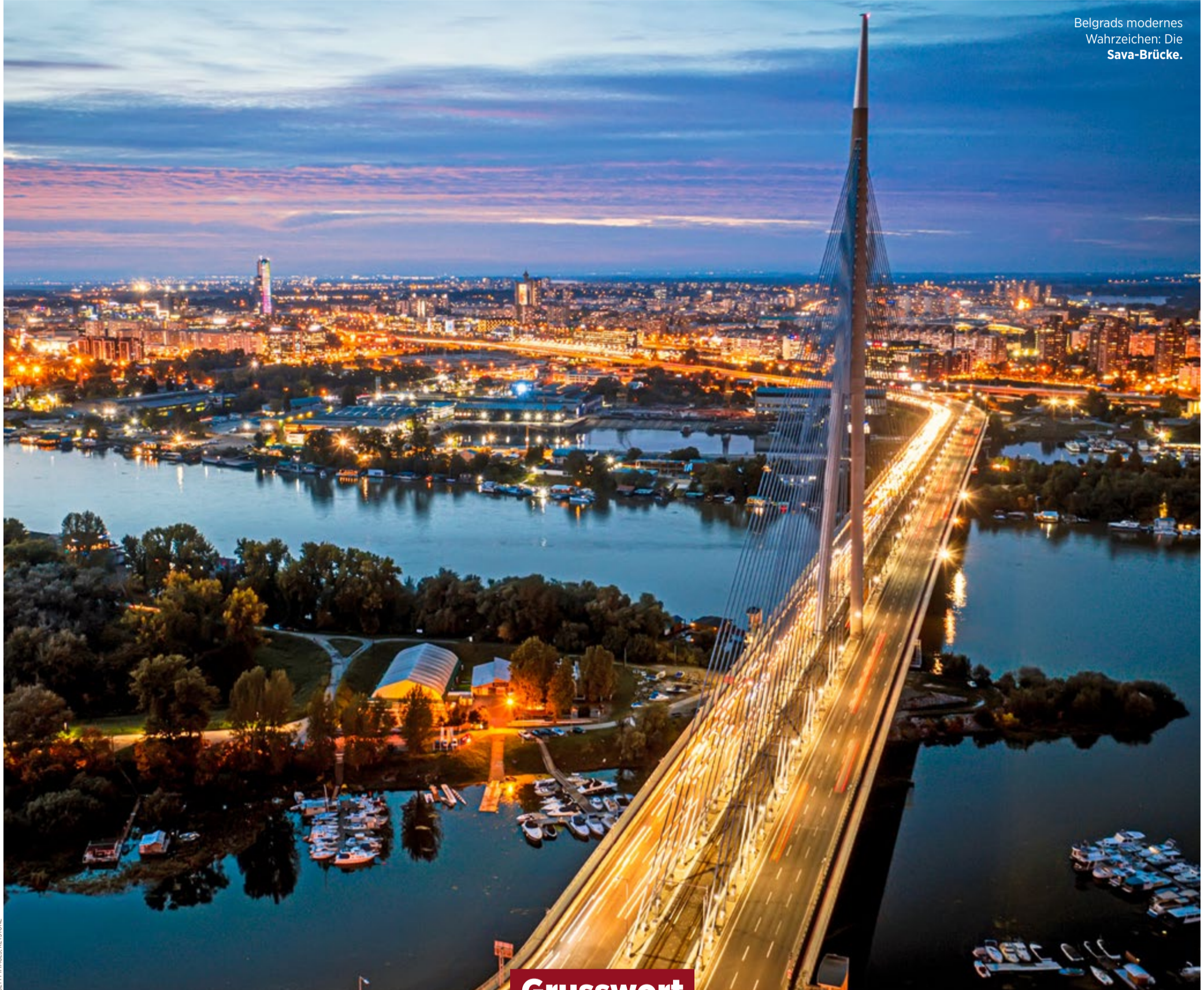
Belgrads modernes Wahrzeichen: Die Sava-Brücke.

● ERFOLGSSTORY: Der boomende IT-Sektor in Serbien Seite 46