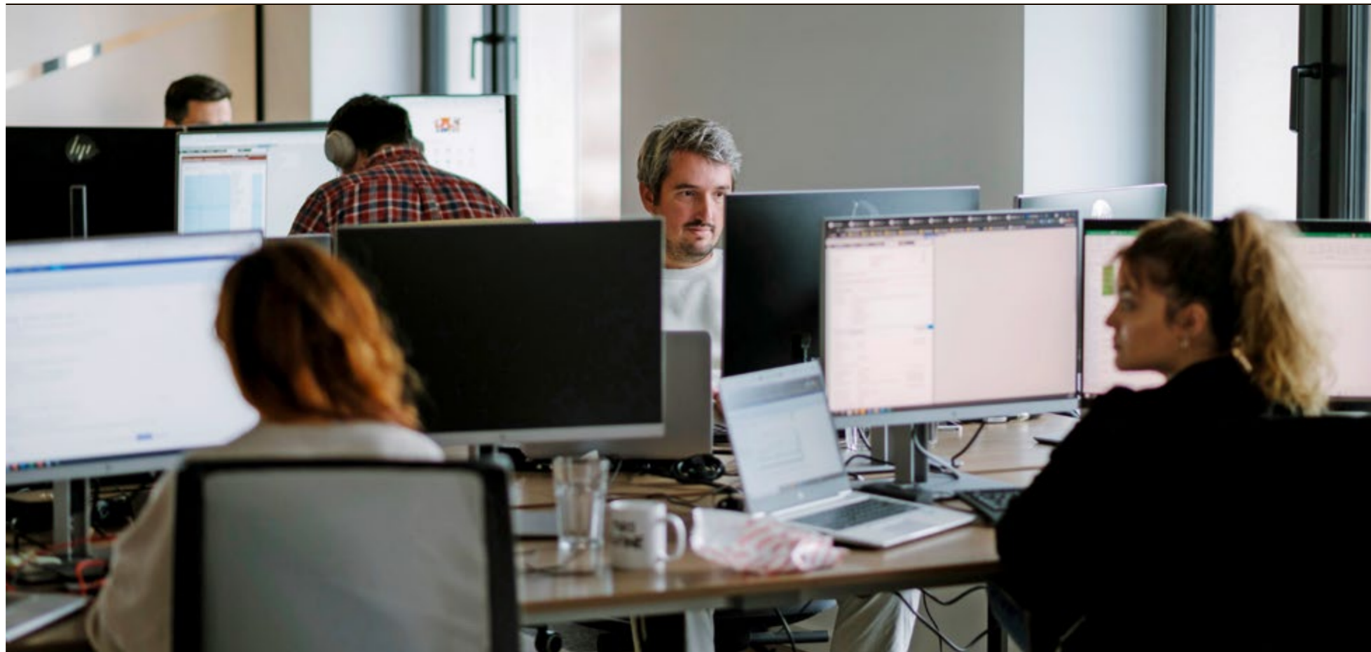
Mitarbeitende von Galaxus Serbia im Büro in Belgrad.