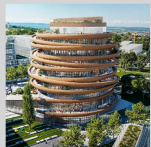
Der hochmoderne BIO4 Campus in der serbischen Hauptstadt.

Der Pharmastandort Serbien punktet durch seine Stärken im Generikamarkt, fortschrittliche Digitalisierung und einen neuen Biotech-Hub.