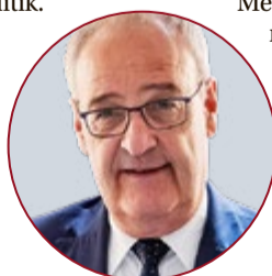
Bundespräsident Guy Parmelin besuchte Serbien Ende April.

Potenzial für einen engeren Austausch gibt es zum Beispiel im Bau-, Verkehrs- und Gesundheitssektor, bei der Informations- und Telekommunikationsbranche oder den erneuerbaren Energien. Die Grundlagen sind gelegt. Jetzt geht es darum, gemeinsam Chancen zu ergreifen. Die Weltausstellung Expo 2027 in Belgrad steht unter dem Motto «Play for Humanity – Sport and Music for All» («Spiel für die Menschheit – Sport und Musik für alle») und eröffnet eine weitere Möglichkeit, die Verbindungen zwischen der Schweiz und Serbien zu stärken, insbesondere in der IT-Branche und im kreativen Sektor, wo Ideen keine Grenzen kennen.