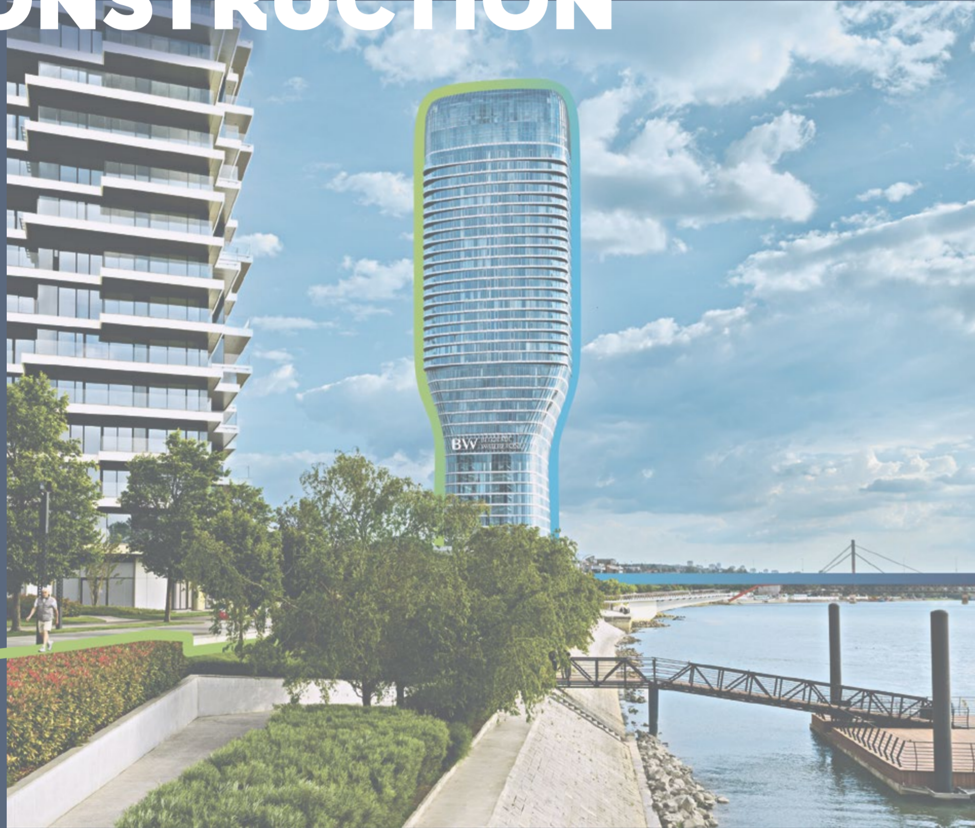
Belgrade Waterfront, Serbia Built with Holcim high-value building solutions