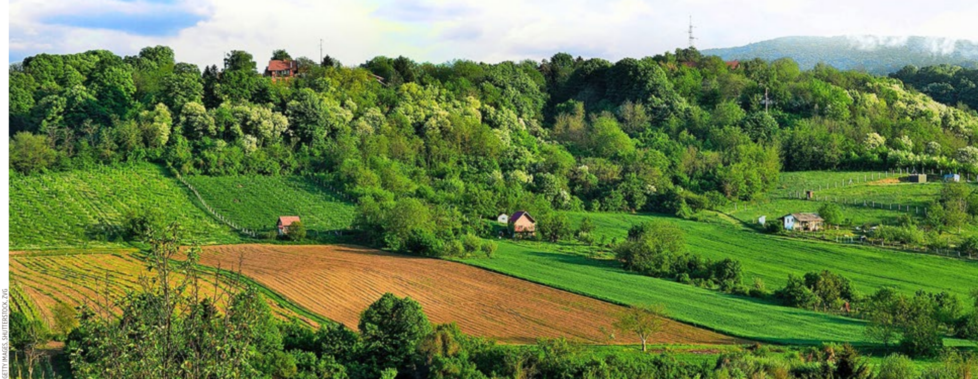
Weinberge und Landschaft in der Region Fruška Gora .