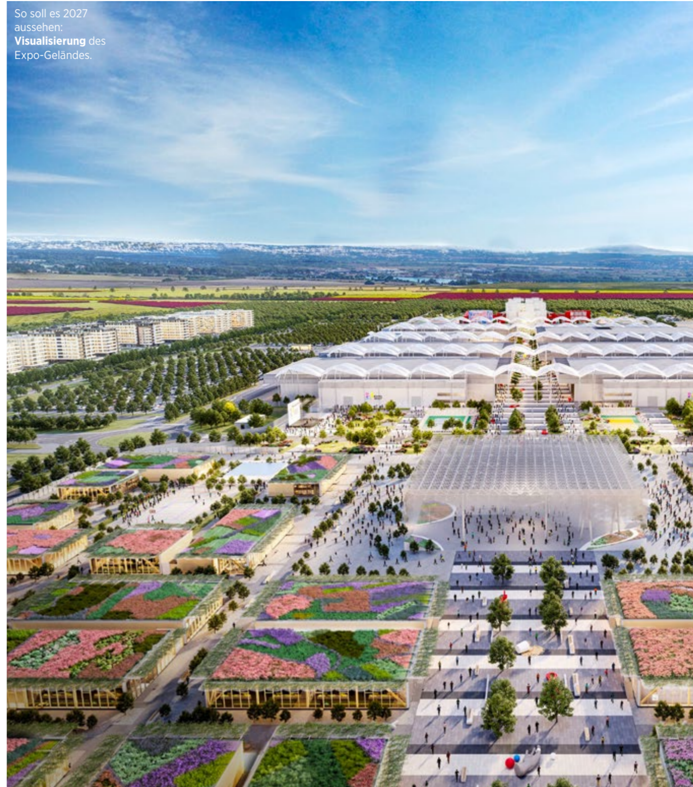
So soll es 2027 aussehen: Visualisierung des Expo-Geländes.