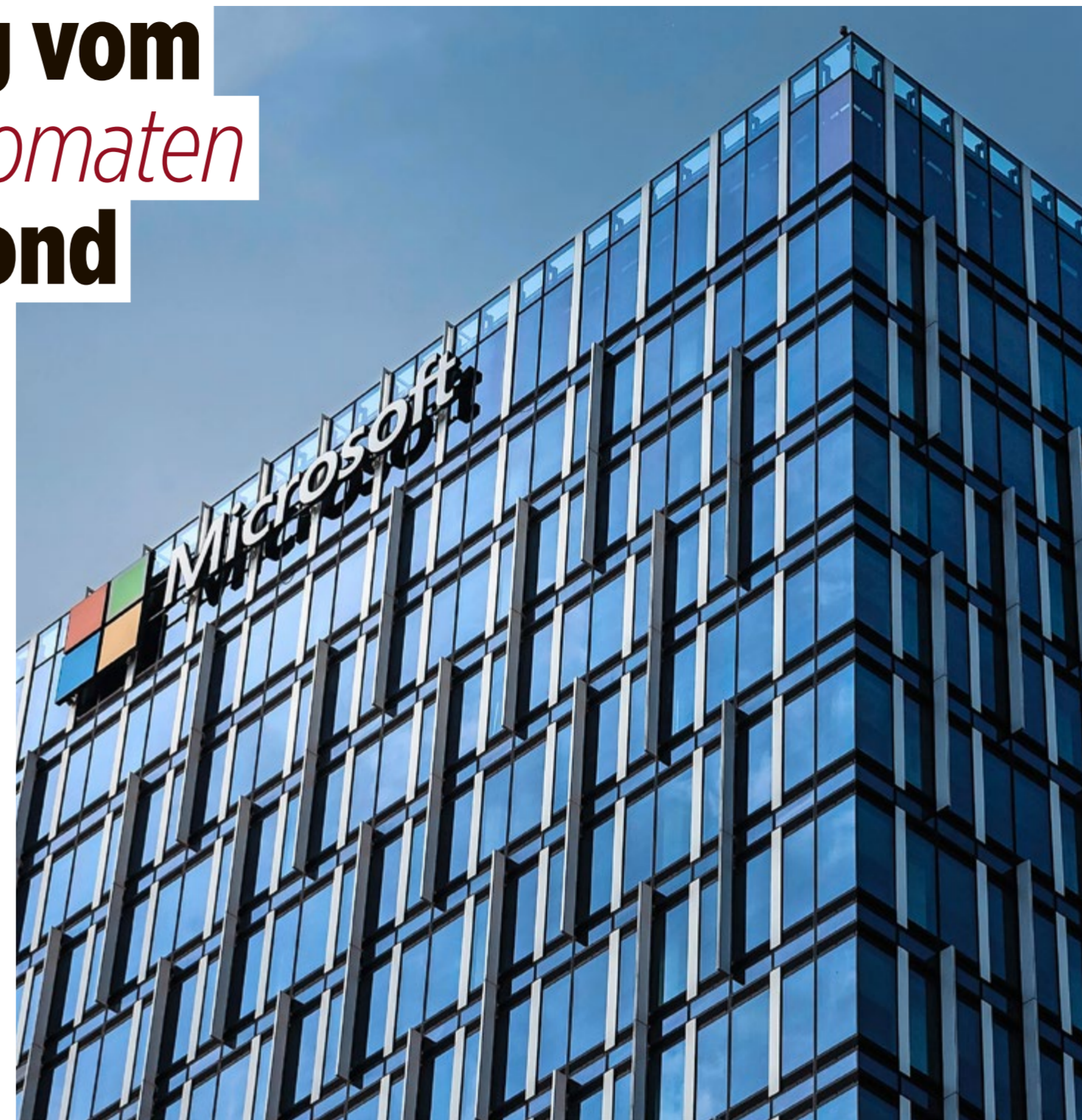
Der Sitz von Microsoft in Belgrad in einem der bekanntesten Twin Tower .

Springen wir in die Gegenwart, etwa zwanzig Jahre später; zwei Gebäude und zwei Direktoren weiter: MDCS belegt den gesamten zweiten Turm der Belgrader Twin Towers, das Wahr-