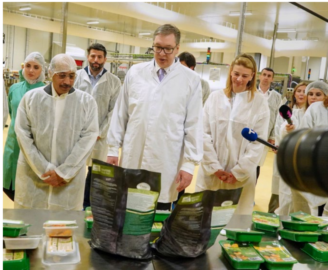
Präsident Vucic bei der Eröffnung eines neuen Werks von Nestlé in Surcin.